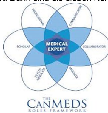
Abb. 1: Die verschiedenen Rollen des Arztes

Education» (ACGME; USA) [1,4]. In der Schweiz wurde das CanMEDS Modell bereits in der Weiterbildungsordnung implementiert: Darin sind die sieben Kernkompetenzen beschrieben: